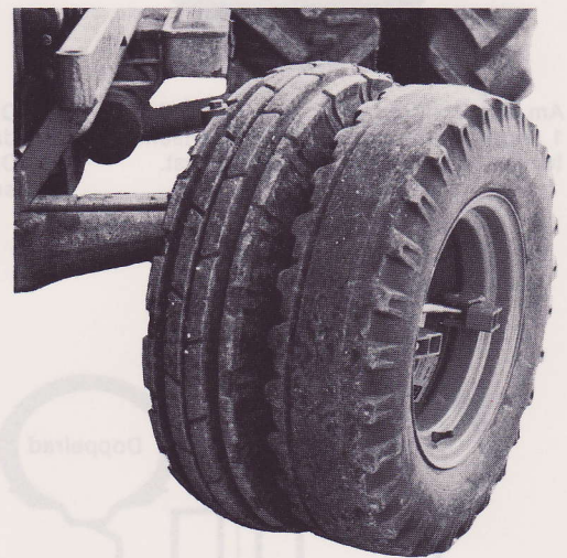
SOK-Doppelrad an Traktorvorderrad